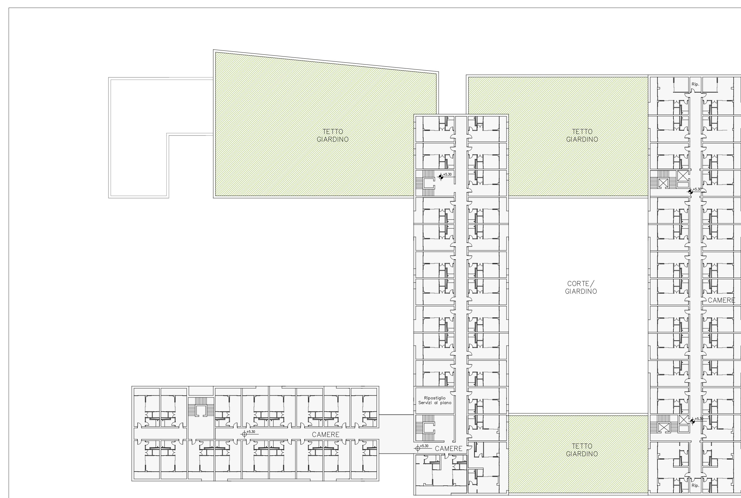
CASONE/ALBERGO_Pianta Piano Primo