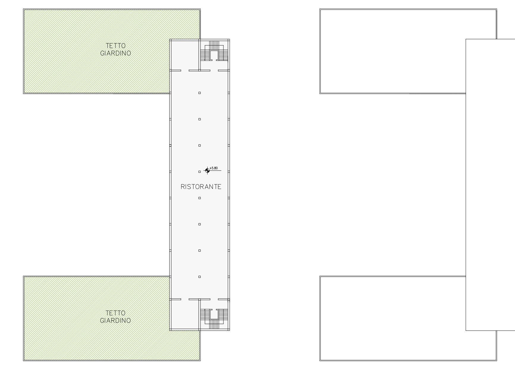
MERCATINO_Pianta Piano Primo