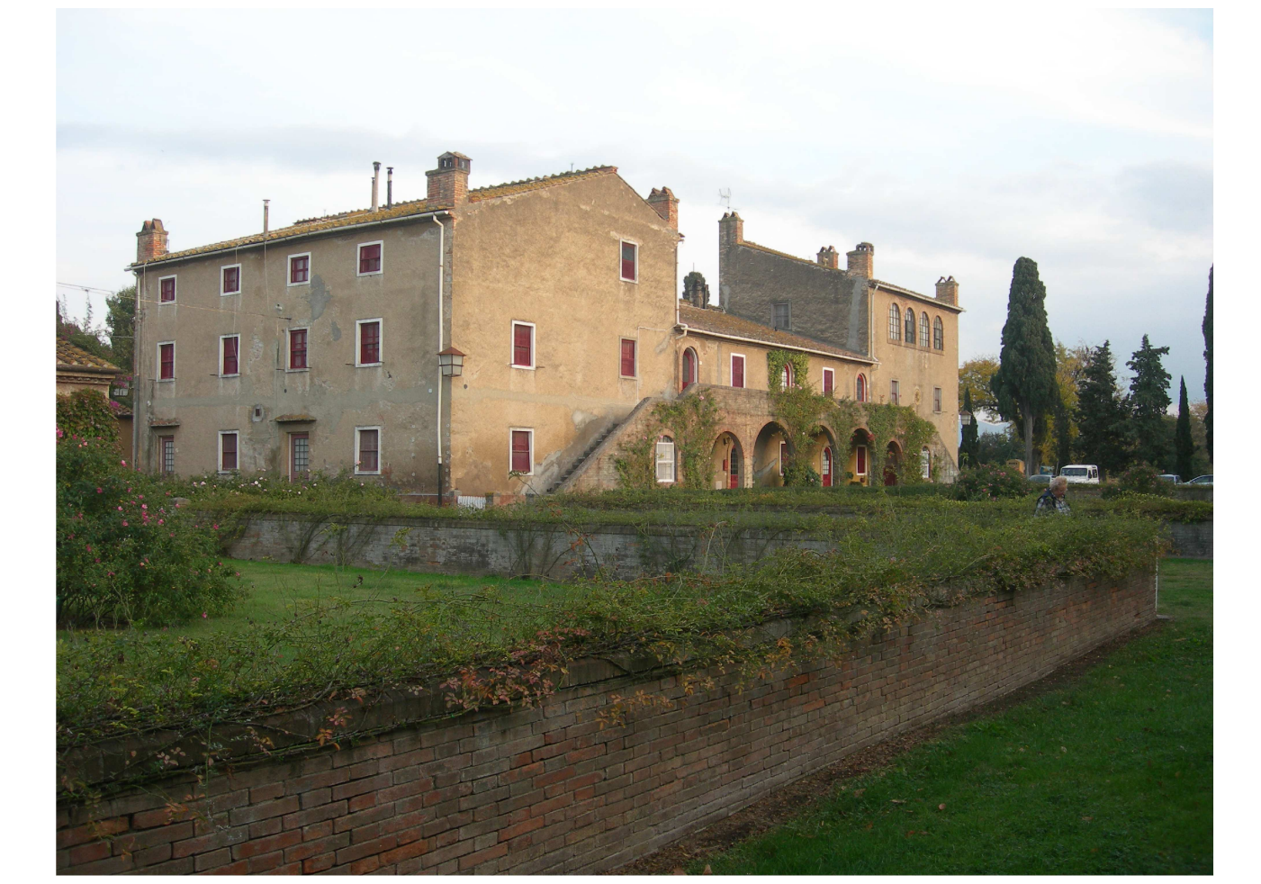
BOLGHERI_La Fabbrica "rurale" di San Guido-Casone