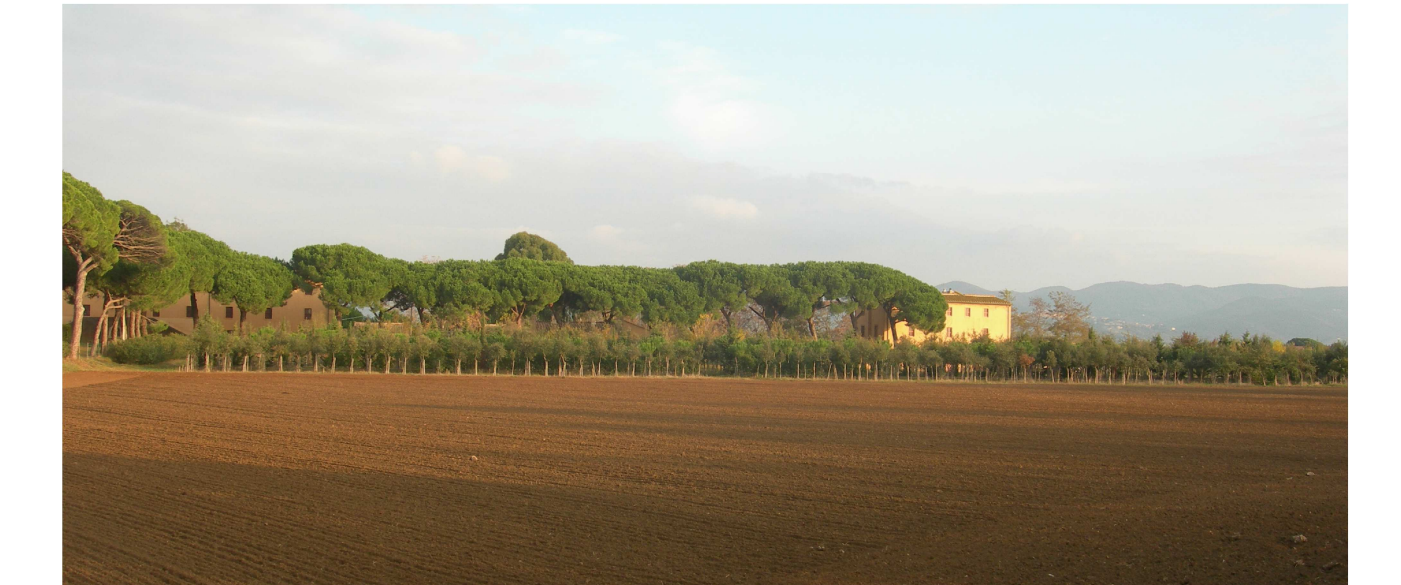
Azienda agricola "Guido di Tasso" Un intervento inserito nel contesto