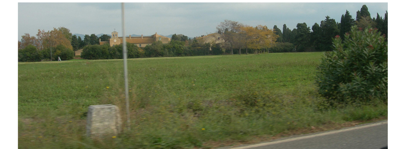
BOLGHERI_Vista dalla strada Aurelia della fabbrica di San Guido